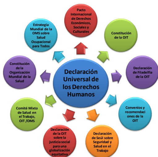
Figura 2. Instrumentos Internacionales donde se indica el Derecho a la Seguridad y Salud Ocupacional.

Más allá de promover la gestión de la salud y la seguridad ocupacional como una obligación o un requisito legal por cumplir, se entiende como un derecho humano fundamental; su implementación como tal, permite mantener una continuidad del negocio, pues aporta un progreso continuo en la gestión de las empresas al integrar la prevención de los riesgos laborales en todos los niveles jerárquicos y organizativos, reforzar la motivación de los colaboradores, propiciar un ambiente de trabajo ordenado y seguro, y fomentar una cultura de compromiso con la seguridad y la promoción de la salud.