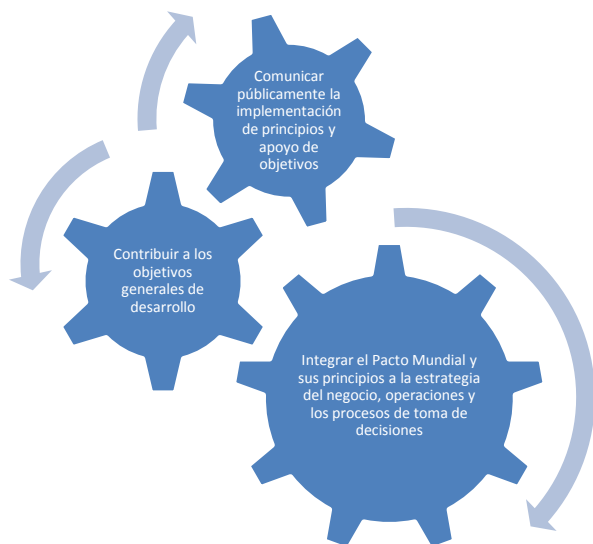
Figura 2. Acciones para la implementación de Pacto Global